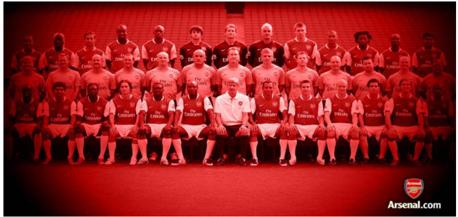
Het Londonse Arsenal heeft in de 26-koppige selectie slechts 2 spelers met een Engelse nationaliteit... En zes (!) Fransen...

'Verrijking' is de start van een inspanning, van de kant van de immigrant én van de kant van de ingezetene! De immigrant maakt kennis met andere zienswijzen op het gebied van o.a. huwelijk, relaties, religie en de verhouding met de ouders. De ervaring is ook: we raken iets kwijt! Dat aanpassingsprobleem is overigens een universeel verschijnsel wat je ook ziet bij de verhuizing van het platteland naar de grote stad. De ingezetene ziet ook veel veranderen. De omgeving, de